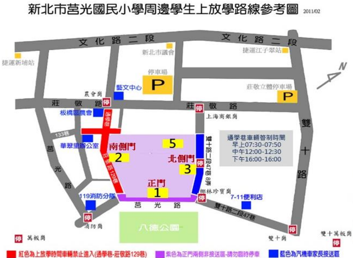
新北市莒光國民小學周邊學生上放學路線參考圖