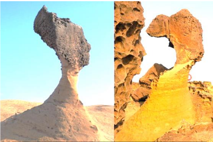
左圖：女王頭 右圖：俏皮公主

按照臺灣北部地殼平均上升速度推算，女王頭的芳齡將近 4000 歲，如此特別的形狀，使得女王頭自此成為野柳的地標，但也讓它飽受盛名之累。除了常年風吹、日曬、雨淋之外，遊客的不當行為也加速了侵蝕的速度，2008 年量測頸圍最細的部份約為 138 公分，近年來各界都很擔心將來總有一天女王頭會消失在這個世界上，而在 2010 年找到了「皇室接班人」——「俏皮公主」，許多遊客都認為「俏皮公主」是女王頭分身，相似度達 70%，希望可以分散遊客的注意力，減緩女王頭受到人為破壞的機率。下次前往野柳地質公園時，千萬記得用相機代替手，當個愛護環境的好遊客喔！